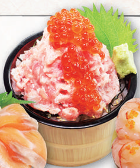
①サーモン親子小丼 ②生えび卵小丼 ③ねぎとろイクラ小丼