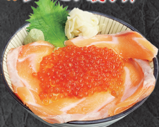
テイク丼ぶり 2,150円 人気のサーモンとイクラのコラボ丼。