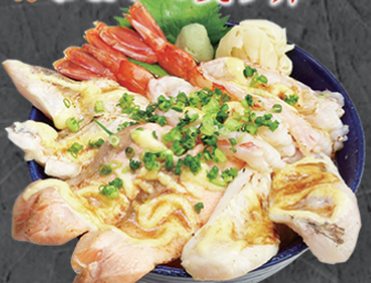
テイク丼ぶり 1,600円 3種類~のマヨ炙り! 言わずと知れた人気丼。定番丼ぶり上位の鮭2色丼のコラボです。