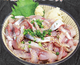
テイク丼ぶり 1,850円 新鮮なアジタキと相性の良いネギと生姜で。