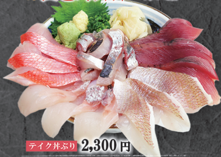
テイク丼ぶり 2,300円 その日次第の魚貝類が5種入った限定海鮮丼。