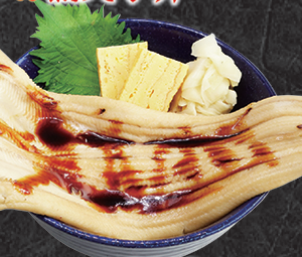
テイク丼ぶり 1,890円 トロっと柔らかでコク旨い煮穴子丼。

各写真は店内でご飲食用の写真を使用しているのでテイクアウトでは「折り〆桶」になります。