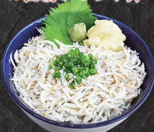
テイク丼ぶり 1,490円 良い塩梅の釜揚げしらすが乗った丼です。