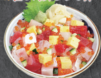
テイク丼ぶり 2,180円 海鮮ネタを刻んで軽くタレに絡めた逸品。