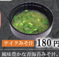
テイクみそ汁 180円 風味豊かな青海苔みそ汁。