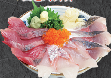
テイク丼ぶり 1,830円 日替り鮮魚ネタが3種類入った海鮮丼。